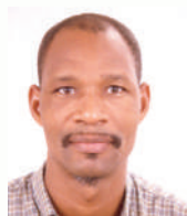
D. Ali Bety

-D. Ali Bety . Ministro y Alto comisionado de la Iniciativa 3N de la República de Niger/ Minister and High Commissioner of the 3N Initiative of the Republic of Niger